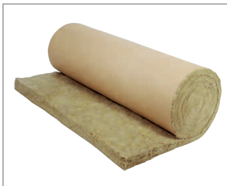
ROULROCK KRAFT PERFORÉ